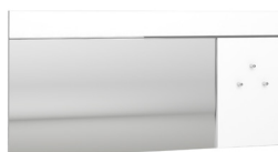
MIROIR N°23 MIRROR N°23 L 120 x H 60 x P 3 cm 19CE1711