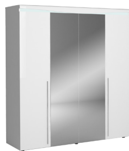
ARMOIRE 4 PORTES N°25 LED incl. 4 DOORS WARDROBE N°25 LED incl. L 200 x H 218 x P 55 cm 19CE5420