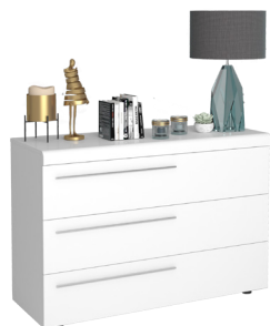
COMMODE 3T N°22 CHEST OF 3 DRAWERS N°22 L 120 x H 86 x P 46 cm 19CE1403