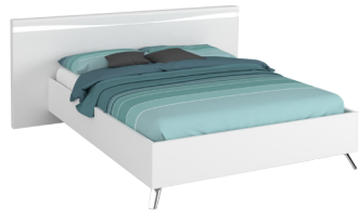
LIT 160 N°19 LED incl. BED 160 N°19 LED incl. L 200 x H 90 x P 210 cm 19CE0316