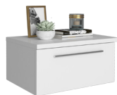
CHEVET SUSPENDU 1T GAUCHE N°11 BEDSIDE TABLE LEFT N°11 L 51 x H 25 x P 37 cm 19CE1301