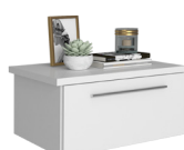
CHEVET SUSPENDU 1T DROIT N°12 BEDSIDE TABLE RIGHT N°12 L 51 x H 25 x P 37 cm 19CE1201